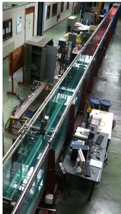
Canal à houle de 30 m du LEGI qui sera adapté au cours du projet WATU pour étudier la turbulence d'onde à 1D

Au cours de cette thèse expérimentale, le doctorant sera amené à mettre en place des expériences dans le canal à houle 1D du LEGI. Ce canal a une longueur de 36 mètres et est actuellement utilisé pour des études de dynamique sédimentaire sur les plages (photo ci-contre). Le doctorant développera un nouveau système de génération et contrôle des vagues (fréquences jusqu'à 5Hz) et un système de mesure du profil de vagues par imagerie fournissant une mesure résolue en temps et en espace des déplacements de la surface libre. Pour les besoins de contrôle ces mesures seront complétées par des mesures ponctuelles de déplacement de surface libre et de vitesse par vélocimétrie ultrasonore. On pourra ainsi étudier de manière très fine les couplages forts ou faibles entre ondes et effectuer des comparaisons avancées entre théories et expériences. Le doctorant sera également associé aux autres études du projet pour partager notamment les techniques de mesures et comparer les résultats obtenus dans différentes configurations.