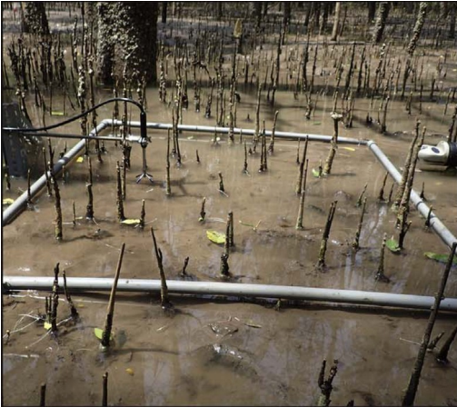
Figure 1: Pneumatophores in a mangrove forest in Vietnam (Norris et al. 2017)

Affiliation : Université Grenoble Alpes, LEGI, CNRS UMR 5519, Grenoble, France